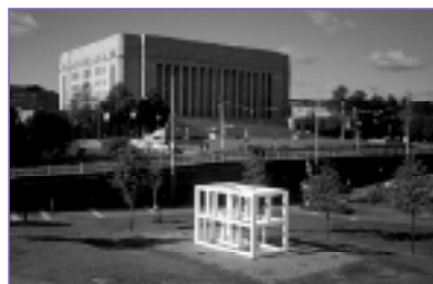
Kiasma Museum Finlandia 2001