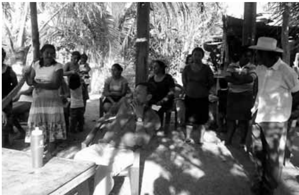
Comunidad Tierra de Israel en el Departamento de La Paz

apoyo más que las de la Alcaldía Municipal de San Julián y UTPMP ES (UTPMP ES, 2008).