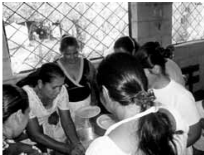
Mujeres participantes de proyectos de UTPMP. Comunidad Tierra de Israel, Departamento de La Paz.

Estas mujeres han descubierto que el pertenecer a la Directiva y su gestión dentro de la misma es valioso para ellas, su familia y la comunidad. La Presidenta de la Directiva lo confirma: “yo, con mis años, no trabajo sólo por mí, trabajo por los cipotes que están creciendo, para que vivan en un lugar bonito” . Por motivos como el señalado anteriormente, las mujeres de la comunidad dejan a un lado su cansancio producto de la doble carga laboral para participar en la Directiva.