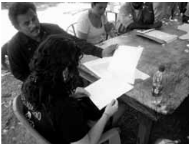
Mesa de trabajo de la comunidad Tierra de Israel, Departamento de La Paz

1 La directiva comunal funciona como ente planificador de proyectos que impulsen el desarrollo comunal. Está conformada por pobladores del asentamiento, quienes no tienen obligaciones legales sobre su cargo. Las Asociaciones de Desarrollo Comunal (ADESCO) son asociaciones con personalidad jurídica que tienen como objetivo el desarrollo sostenible de la comunidad. Tienen poder para gestionar fondos para su organización. Poseen estatutos que las obligan a cumplir deberes y a otorgar derechos a sus miembros por el solo hecho de ser parte de la ADESCO.